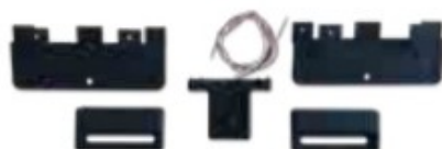
COD. FC003 | FINE CORSA MAGNETICO MAGNETIC LIMIT SWITCH

* Contropiastrea non inclusa. The fixing plate is not included • Per una migliore ricezione radio si consiglia l'utilizzo di un'antenna esterna cod. 210/1. Is recommended the use of an external aerial to improve radio reception • In presenza di temperature rigide la prestazione dell'attuatore si può ridurre notevolmente. Very low temperatures could reduce the performance of the actuator